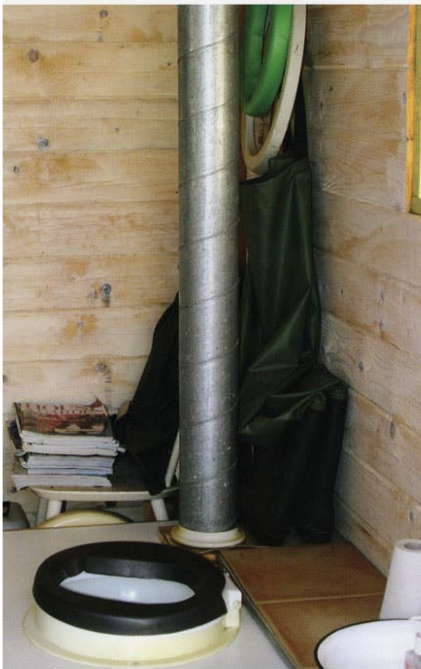
Den första anläggningen från 1939 finns kvar och används som gårdens "utedass".

"Vi kan inte lösa problem med samma tanke sätt som vi använde när vi skapade dem."