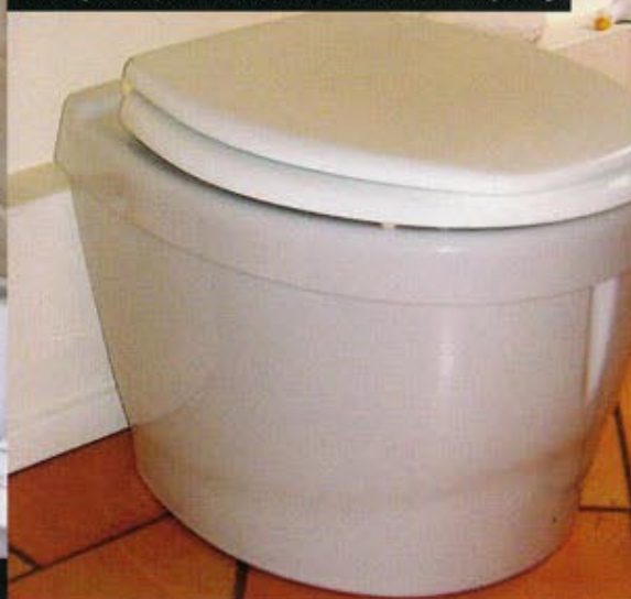
Den långtidskomposterande toaletten är helt luktfri och miljövänlig.