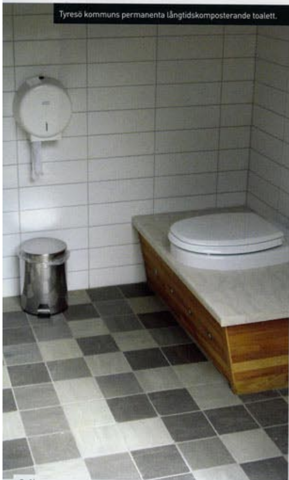
Tyresö kommuns permanenta långtidskomposterande toalett.

– Trots att vi är mycket väl medvetna om att det är fel, fortsätter vi ändå att spola bort och förorena dricksvatten. Långtidskomposteringens teknologi bryter radikalt mot det vi är pottränade för.