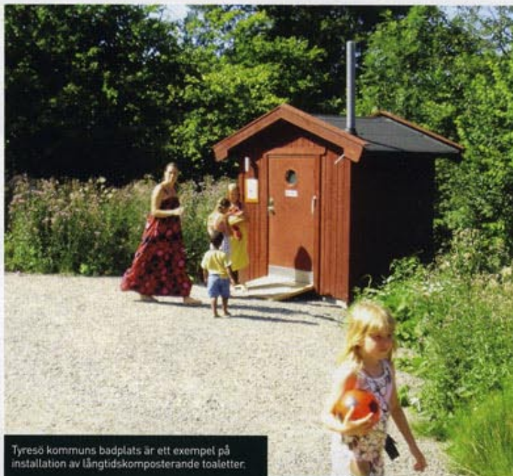
Tyresö kommuns badplats är ett exempel på installation av långtidskompostering toaletter.

Han vill på ett nytt sätt återföra den rena växtnäringen från mänskligt avfall till jordbruket. Och han anser att vi måste våga trotsa våra idéer om att flytta avfallet. Långtidskomposteringen sker utan